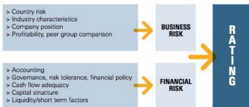
FIGUR 5 65

Business risk omfatter primært systemiske risikomomenter, der ikke er begrænsede til den omhandlede virksomhed, mens financial risk kan omfatte f.eks. årsregnskaber, aktuelle budgetter, medieomtale o.l., men også mere subjektive momenter som f.eks. ledelsens sammensætning og erfaring, virksomhedsstrategi o.l. 66